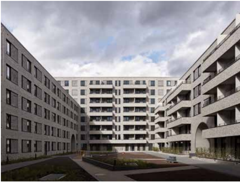
Moderner Wohnungsbau 2020 nach Art des Bezirks Nord im Pergolenviertel. Das Bild zeigt den nördlichen Doppelhof und den südlichen Hof. Ausgezeichnet mit dem 1. Preis, Bauherr SAGA. In der Anpreisung heisst es, „die Neubauten im Pergolenviertel orientieren sich typologisch am Hamburger Reformwohnungsbau der zwanziger Jahre“. Bild © Winking · Froh Architekten

Den also nicht nur im Langenhorner Bürger- und Heimatverein getragenen Leitgedanken wird der von der Verwaltung vorgeschlagene reine Geschosswohnungsbau im Diekmoor in keiner Weise gerecht. In der Präsentation des Fachamts wird zusammen mit dem Wohnungsneubau nur die allernötigste Infrastruktur in einer Zeile erwähnt: Nahversorgung, soziale Infrastruktur (z.B. Schulflächen). Dabei existiert unmittelbar anschließend an die vorgeschlagene „Suchfläche“ für den Geschosswohnungsneubau im Diekmoor entlang der Straße Diekmoorweg und daran anschließend ein teils neu errichteter, teils älterer Geschosswohnungsbestand von ca. 800 Wohnungen. Alle diese wurden errichtet ohne die geringste Berücksichtigung des evidenten Bedarfs an sozialer Infrastruktur, angefangen mit der dort nicht vorhandenen Nahversorgung. Insofern steht zu befürchten, dass sich dies mit der Diekmoorbebauung schlichtweg fortsetzen wird.