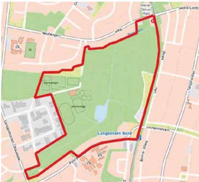
Die Karte zeigt das gleiche Gebiet wie die Karte links. Mit rot eingezeichnet ist die so genannte „Gebietsabgrenzung Rahmenplanung“ – also das gesamte Gebiet, welches in die Planungen einbezogen ist.

In der Februarausgabe 2019 der Langenhorner Rundschau, kurz vor den Hamburger Bezirksversammlungswahlen vom Mai 2019 und mit einem Jahr Vorlauf zur Bürgerschaftswahl vom Februar 2020, hatte der Langenhorner Bürger- und Heimatverein die Hauptergebnisse seiner im Vorjahr abgehaltenen fünf öffentlichen Zukunftskonferenzen zu seinem „Konzept 2050“ vorgestellt. In denen hatten die Langenhorner selbst erörtert, wie sich ihr Stadtteil langfristig entwickeln sollte. Grundverständnis war dabei, dass eine Stadt mit begrenztem Raum nicht unbegrenzt wachsen kann. Nötig sei ein gesteuertes, intelligentes Qualitätswachstum – nicht viel,