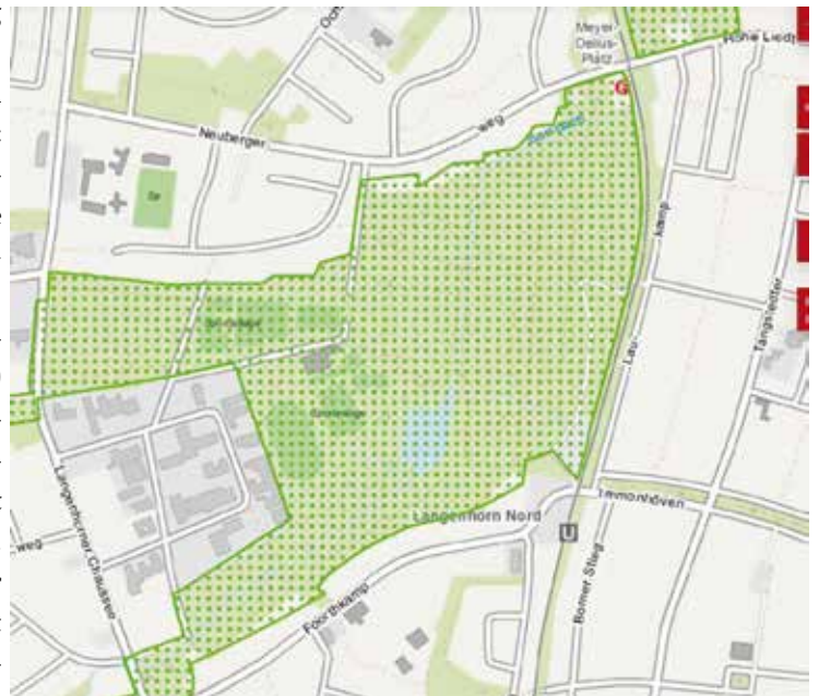
Die Karte zeigt den aktuellen Stand des Landschaftsschutzes. die grün gepunkteten flächen stehen unter Landschaftsschutz. Einzelne Biotop, Pflanzen und Tiere sind gesondert geschützt.

Klare Worte zur Beendigung der Hamburger „Bauwut“ findet hingegen der BUND Landesverband Hamburg. 3 Lt. BUND darf ein angespannter Wohnungsmarkt kein Freibrief für das Bauen um jeden Preis sein. Nachhaltige Stadtentwicklung, Klimakrise und Artensterben fordern gerade